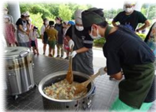
カレーも作りました！