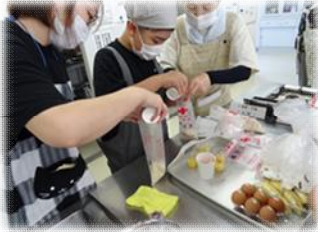
ビニール袋にお米！？