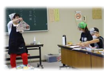
何ができるのかな？